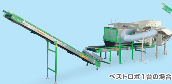
ベストロボ1台の場合